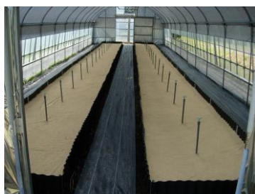
【養生ハウス外観・内部の様子】