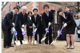
【京都市：同志社大学】